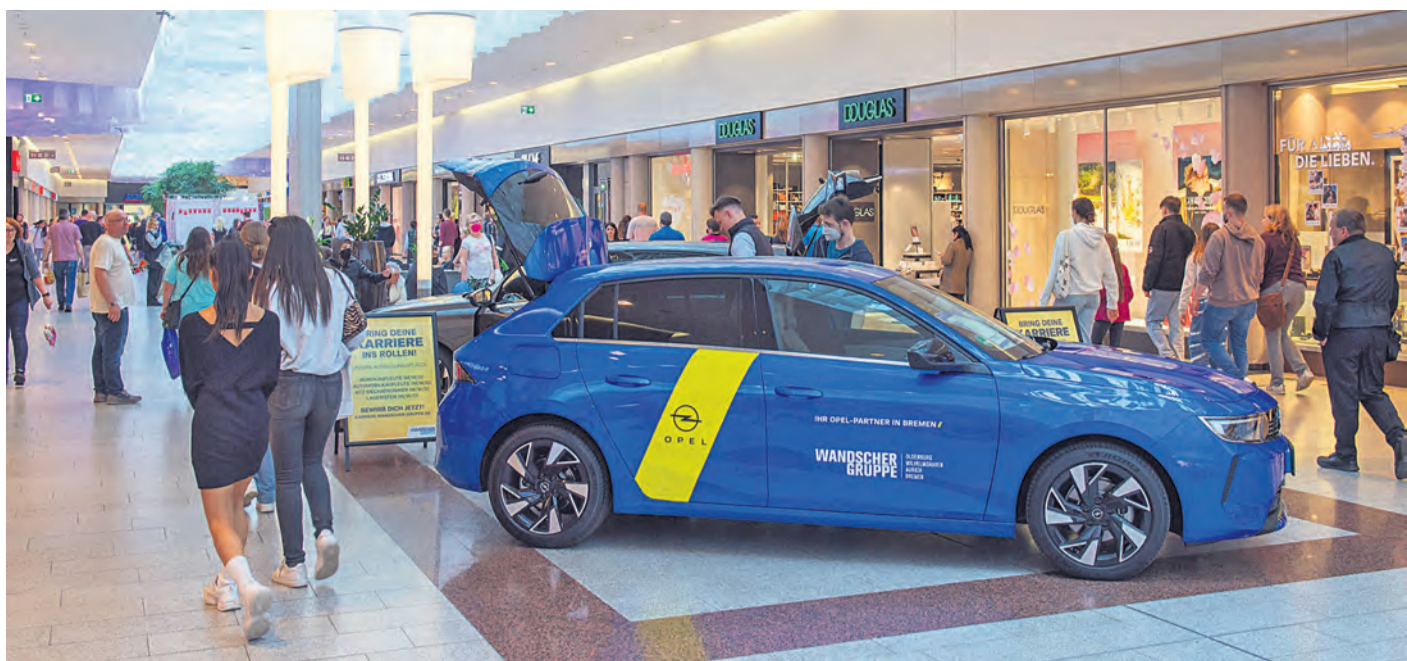
Viele GO-Besucher nutzten auch den verkaufsoffenen Sonntag zum Bummeln und Einkaufen im Weserpark.

Weitere Informationen im Internet unter: apotheken.de und aponet.de