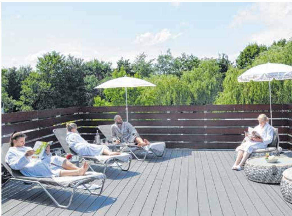
Entspannung pur: Gerade in den Sommermonaten lädt das Saunadort der OASE zu einem besonderen Wellnesserlebnis unter freiem Himmel ein.