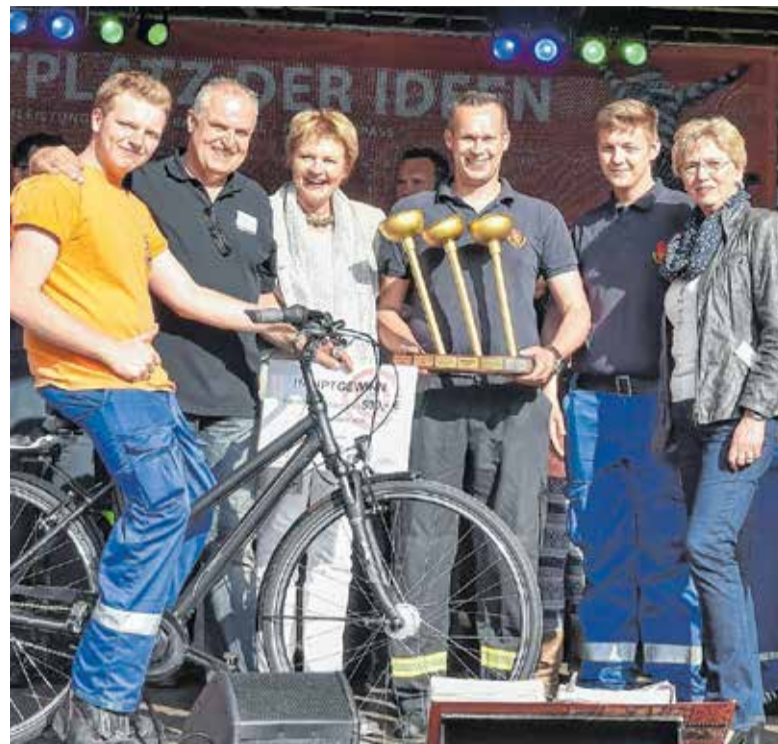
So sehen Sieger aus: Auch in diesem Jahr findet im Rahmen der GO wieder die traditionelle Pümpelmeisterschaft statt.

ÜBERSEESTADT BREMEN BESUCHEN SIE UNS AUCH IN UNSEREM INFOZELT!